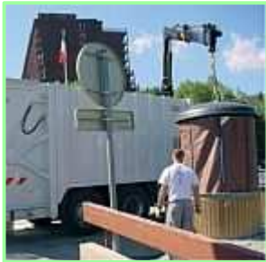
Der Fahrer hebt den Tragesack mit dem Kranarm aus dem Container

Seracc Container werden in 2 Minuten direkt durch den Fahrer geleert. Grundvoraussetzung ist ein Fahrzeug mit Kranarm und Muldenaufbau. Die Reichweite des Kranarms ermöglicht auch eine Positionierung der Container hinter Mauern, Hecken und anderen Absperrungen.