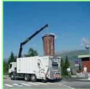
Der Sack wird über das Fahrzeug geschwenkt und mit der Leine geöffnet