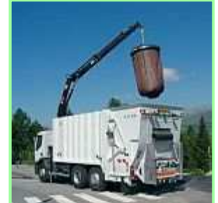
Der Tragesack wird geschlossen und in den Container zurückgesetzt